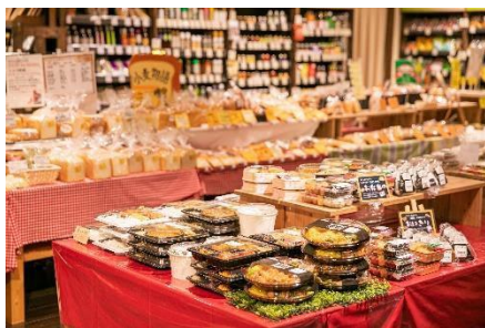
わくわく広場 イメージ