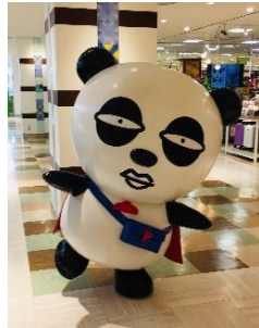
京成パンダグリーティング