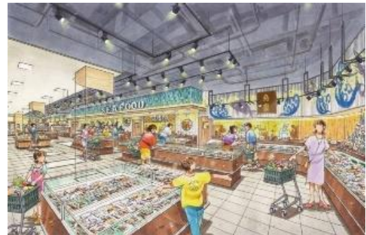
「リブレ京成八千代台ユアエルム店」イメージ

このほかユアエルムの店舗では、生産者とお客様を結ぶ直売スペース「わくわく広場」、国内外からの珍しい食材を集めた「マティス ヤマザキヤ」の全面改装など魅力ある食のゾーンをご提供いたします。