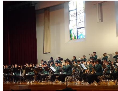
千葉英和高等学校吹奏楽部