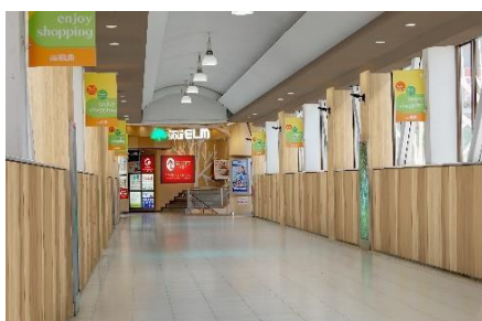
ペDESTリアンデッキ イメージ