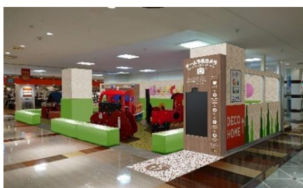
ちやいるどらんど イメージ