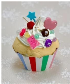
ワークショップ (食品サンプル作り)