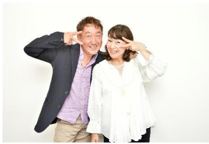
bayfm「Song of Japan」 スペシャルステージ